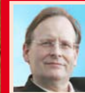
Versöhnlich: Arzt und Bestsellerautor Prof. Dr. Dietrich Grönemeyer („Das Rückenbuch“)

Der Radiologe Prof. Dr. Dietrich Grönemeyer plädiert für die Versöhnung von Schul- und Alternativ-Medizin: „Schulmedizin betrachtet den Organismus gelegentlich wie eine Maschi-