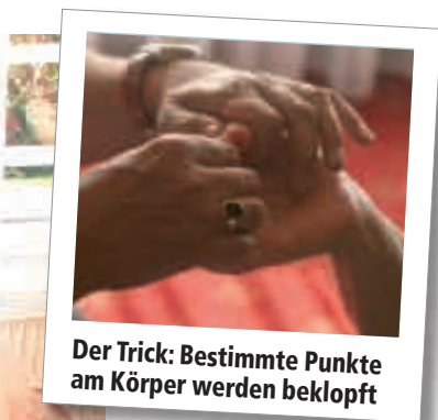
Der Trick: Bestimmte Punkte am Körper werden beklopft

Körper klopfen.“ Irritiert blicke ich auf. Aus dem Körper klopfen? Das klingt ja seltsam. Bei Kopfschmerzen oder Stress könnte ich das noch nachvollziehen – als eine Art Akupressur. Aber dass das bei Geldproblemen hilft, bezweifle ich stark. Trotzdem versuche